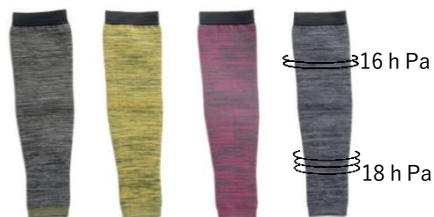
アーミー グレー イエロー グリーン ピンク グレー グレー ブラック