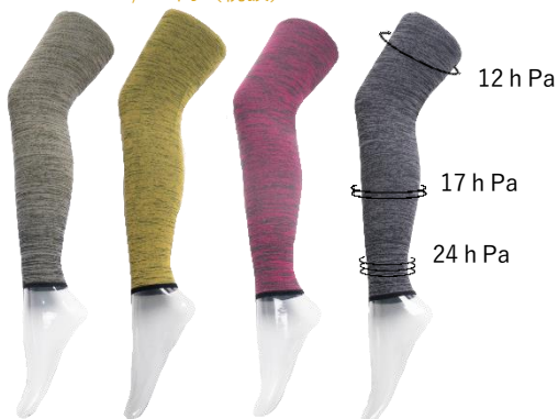
アーミー グレー イエロー グリーン ピンク グレー グレー ブラック

朝すっきりレグライン！ 毎日美脚ケア！リンパめぐり！ むくみすっきり！バランスアップ！