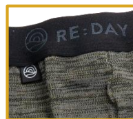
※レギンス・カブリタイツ共通