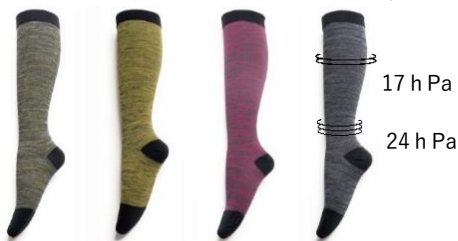
アーミー グレー イエロー グリーン ピンク グレー グレー ブラック