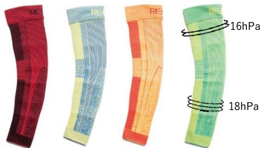
レッド ブルー イエロー グリーン