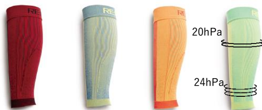
レッド ブルー イエロー グリーン

足首からふくらはぎにかかる理想的な着圧カーブにより運動中のふくらはぎの筋振動を有効的にサポートします。