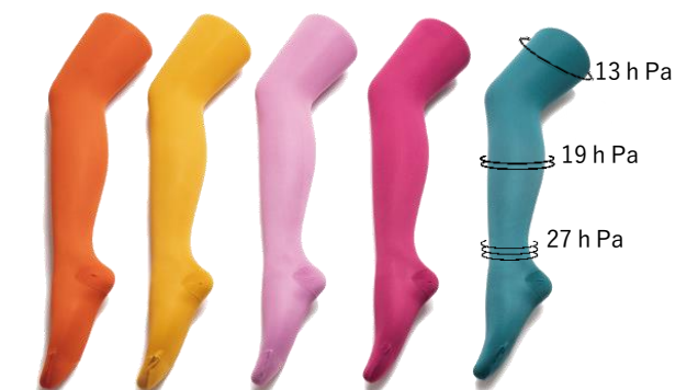
オレンジ マスタード アッシュピンク マゼンタ ブルーグリーン