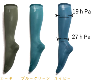
カーキ ブルーグリーン ネイビー