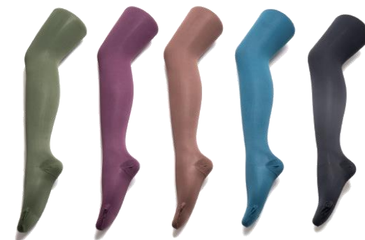
カーキ プラム チョコレート ネイビー ブラック