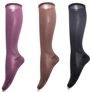
プラム チョコレート ブラック